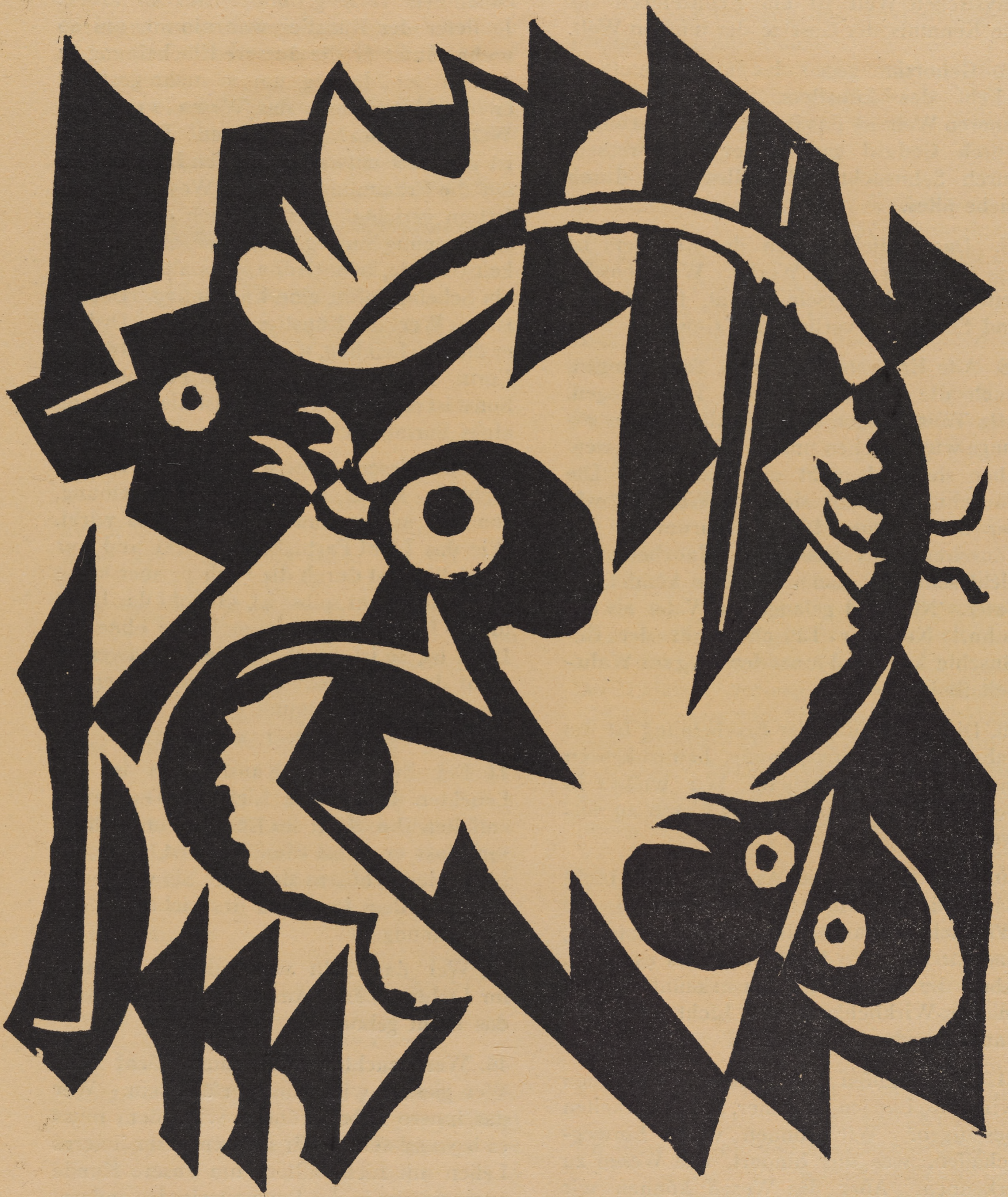
Paul Fuhrmann: Linoleumschnitt / Vom Stock gedruckt