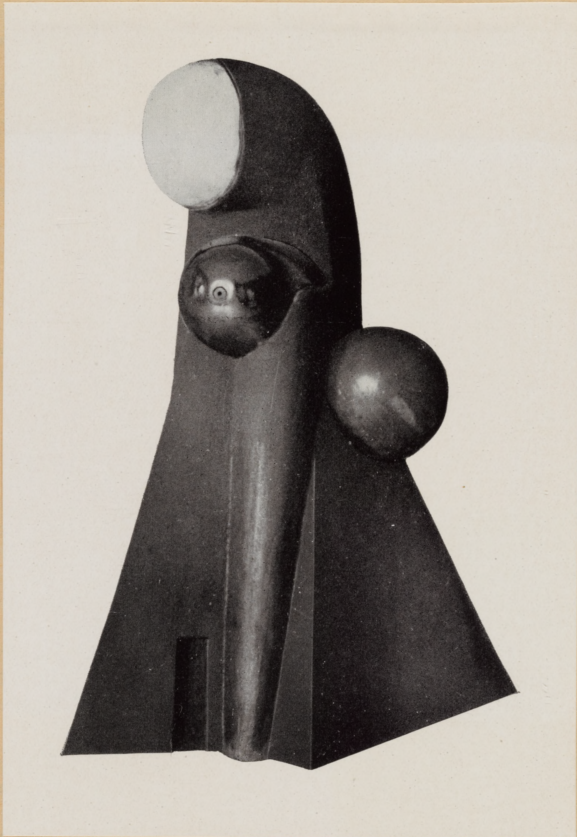
T. Zarnower: Architektur — Plastik